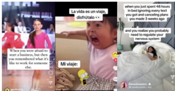
Pov a xarxes socials. Memes, selfies i llenguatge multimodal hiperbòlic. Desbordament de punts de vista.