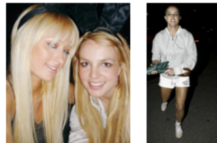
El primer selfie de la història. Britney i Paris Hilton. Punt de vista sobre el propi cos, descontrol emocional i histèria. 2006