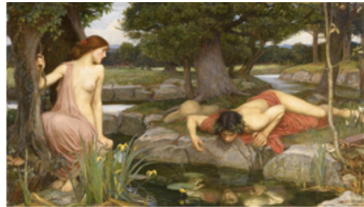
Mite de Narcís i Eco. Punt de vista de la mitologia clàssica. Cos, imatge i reflexe.