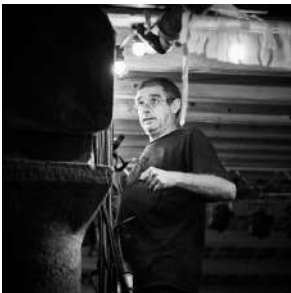
AUGUST VILADOMAT (Catalunya) Il·luminació

A Mal Pelo ha col·laborat en la direcció tècnica i disseny d'il·luminació als espectacles De Haber Nacido i Double Infinite i porta la direcció tècnica de Highlands i Inventions.