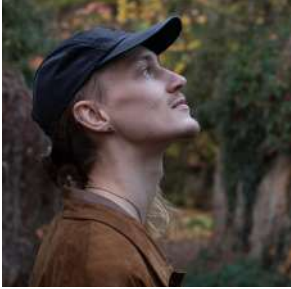
ALEC LETCHER (França) Intèrpret