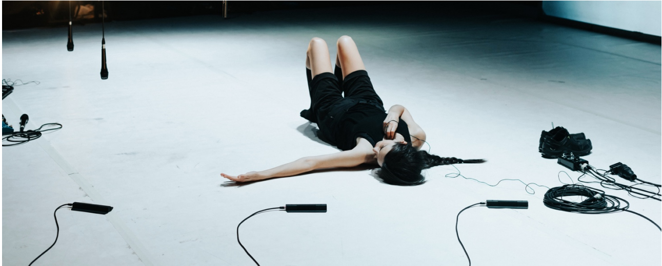
Imatge: Sílvia Poch